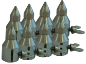
309094 Punte distanziali con bloccaggio conf. 8 pezzi.