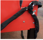
309096 Kit guaine di protezione cavi.