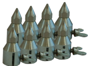
309094 Punte distanziali con bloccaggio conf. 8 pezzi.