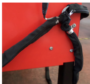
309096 Kit guaine di protezione cavi.